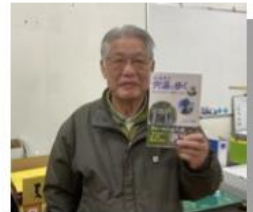
著書『ふるさと宍道を歩く』絶賛発売中!

平成22年から開催し今回で30回目! 宍道の歴史に触れ、巡り歩く旅を楽しみましょう♪