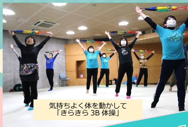
気持ちよく体を動かして 「きらきら3B体操」