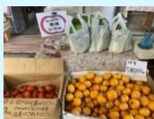
寄り道マーケット