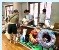
フリマと夏まつり