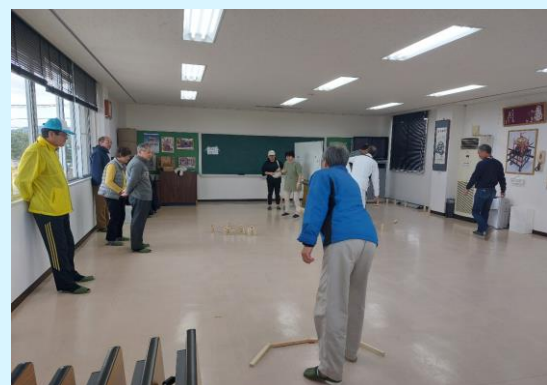
令和5年度スポレク広場を開催しました！