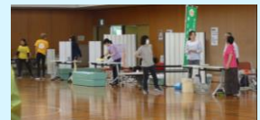
スポレク広場とライフチャレンジ・ザ・ウオークに 沢山の方々が参加してくれました。