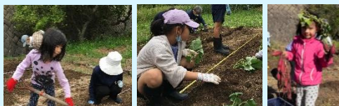
畑体験☆さつまいも (畝作りから収穫まで)