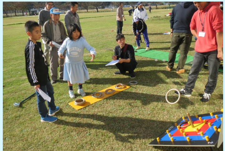
令和元年度の様子