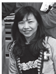
NPO法人しんじ湖スポーツクラブ アシスタントマネジャー